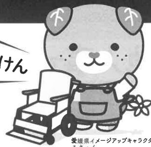
愛媛県イメージアップキャラクター みきやん