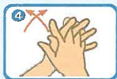
指を組み合わせ手のひらを手のひらに