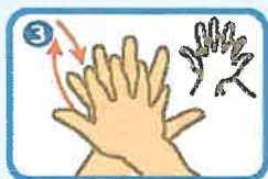
指を組み合わせ、右の手のひらを左の手背に当てる、そして逆も同様に