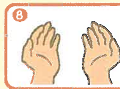
一旦、乾かせばその手は安全です