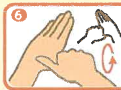
右手のひらで握った左の親指を回転させて擦る、そして逆も同様に