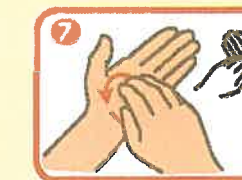
右手の固くした指で左手のひらの中で、前後しながら回転させて擦る、そして逆も同様に