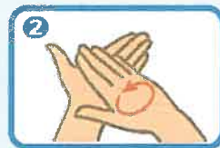
手のひら同士で手を擦る