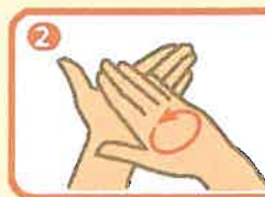
手のひら同士で手を擦る