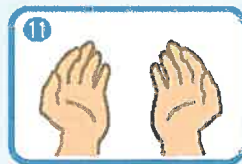
その手は安全です