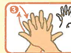
指を組み合わせ、右の手のひらを左の手背に当てる、そして逆も同様に