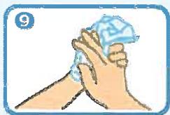
単回使用のタオルで手を完全に乾燥させる