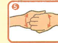
(連結器のように) 連結させた指で指の後ろを反対の手のひらに当てる