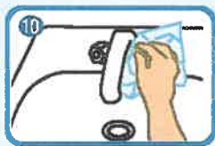
止水栓を止めるためタオルを使う