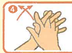
指を組み合わせ手のひらを手のひらに