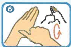
右手のひらで握った左の親指を回転させて擦る、そして逆も同様に